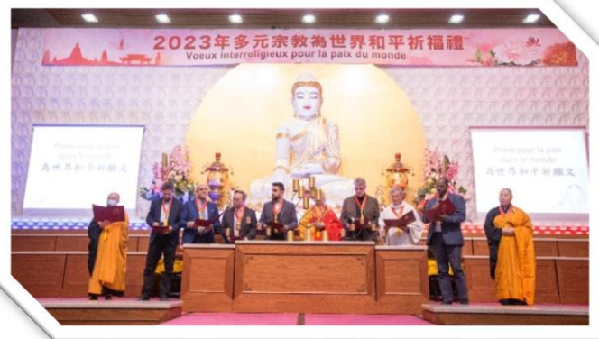
► Messages de paix en communs