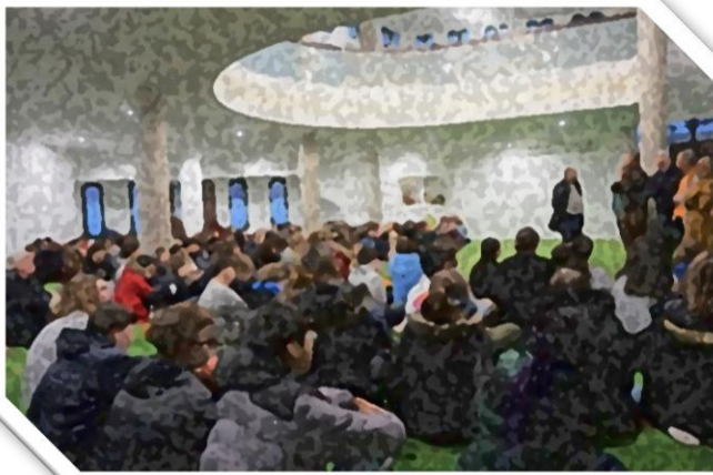
► Visite d'un collège