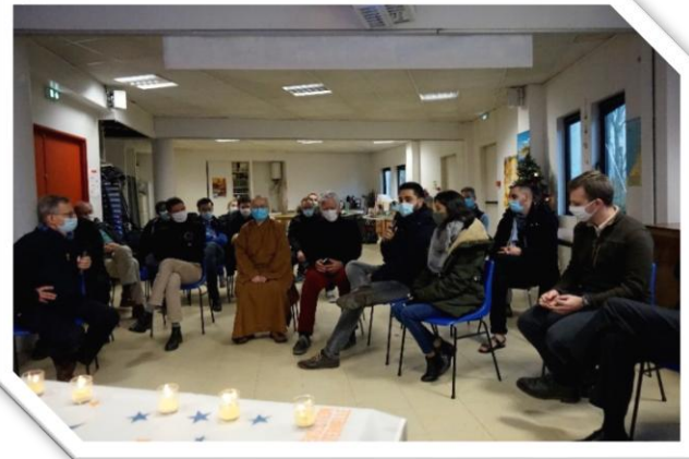
► Rencontre avec Secours Catholique