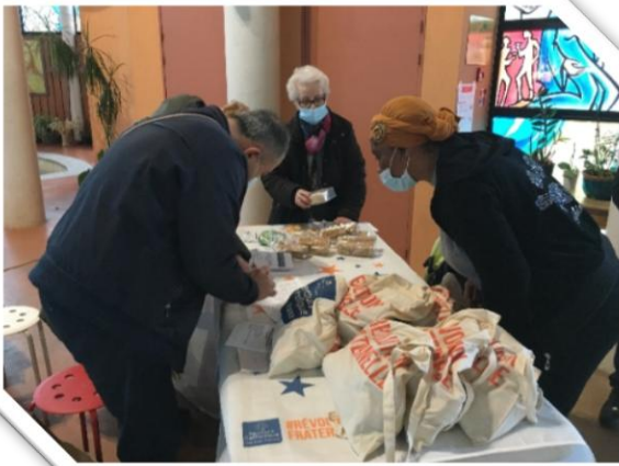
► Noel Solidaire