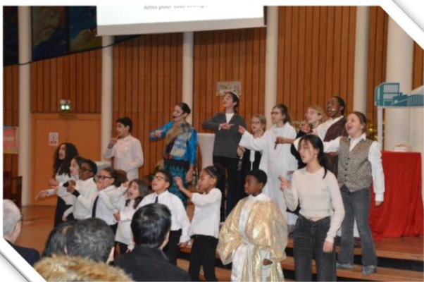
► Spectacles inter-jeunes